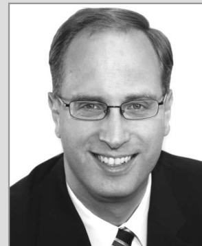
Tobias Koch, MdL