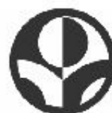
FÖRDERGEMEINSCHAFT KINDERKREBS-ZENTRUM HAMBURG E.V.

„Unsere Herzen für krebserkrankte Kinder“